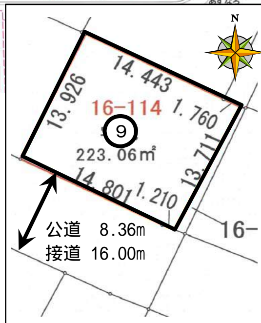
図面は手書きの為、現況を優先致します